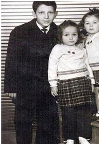
● اردوغان در دوره نوجوانی