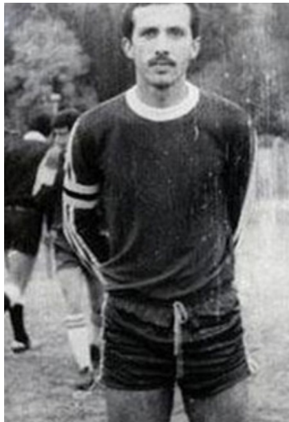
● اردوغان در تیم فوتبال محلی

در سال ۱۹۹۴، اردوغان شهردار استانبول شد. این دوران به چند دلیل سبب افزایش شهرت و محبوبیت اردوغان شد؛ اول اینکه اردوغان در دوران شهرداری خود با پیگیری شعارها و سیاستهای اسلامی موجی از امید را در میان بسیاری از ترکهای مسلمانی ایجاد کرد که با دولت